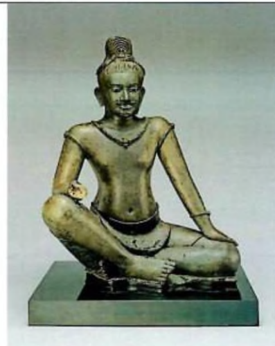
បដិមាព្រះលោកេសូរ សំលោហៈ, សម័យអង្គរ, សតវត្សរ៍ទី១០-១១គ.ស.