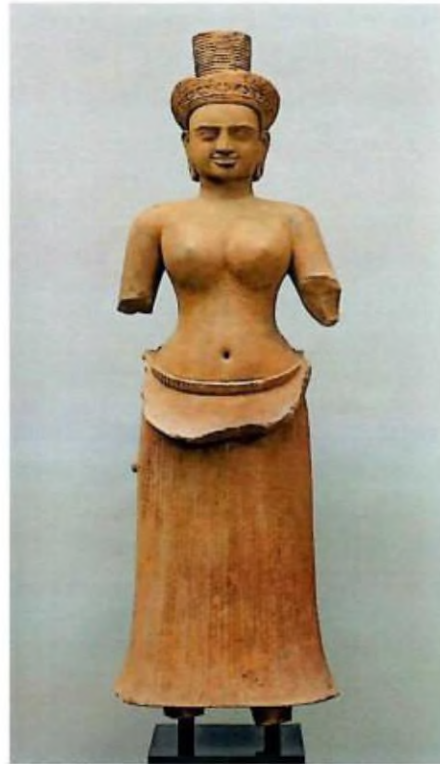
បដិមាទេពស្រី (ព្រះនាងឧមា) ថ្មភក់, សម័យអង្គរ, រចនាបថកោះកេរ, សតវត្សរ៍ទី១០គ.ស. មណ្ឌីយដ្ឋានប្រាសាទកោះកេរ ខេត្តព្រះវិហារ