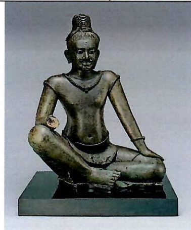
បដិមាព្រះលោកេសូរ

សំលោហៈសម័យអង្គរ ,, ចុងសតវត្សរ៍ទី១០-ដើម១១គ.ស.