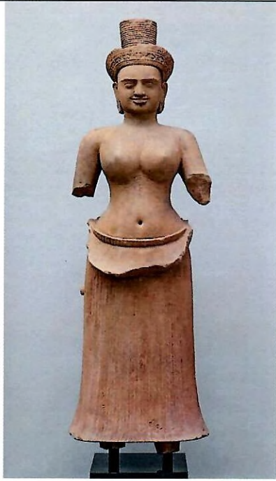
បដិមាទេពស្រី (នាងឧមា)

ថ្មភក់, សម័យអង្គរ, រចនាបថកោះកេរ សតវត្សរ៍ទី១០គ.ស.