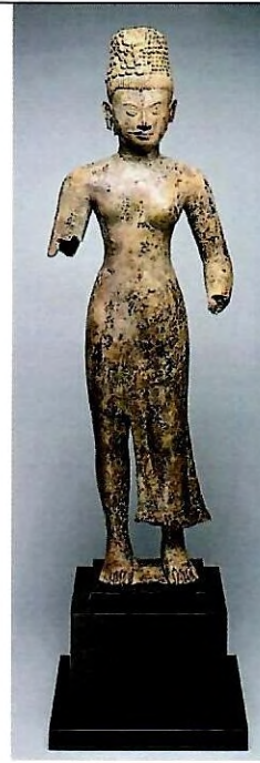
បដិមាអង្គនារីសូរ

ថ្មភក់, សម័យអង្គរ, រចនាបថកោះកេរ សតវត្សរ៍ទី១០គ.ស.