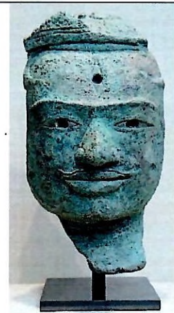
មុខព្រះឥសូរ

សំលោហៈសម័យអង្គរ ,, ចុងសតវត្សរ៍ទី១០-ដើម១១គ.ស.