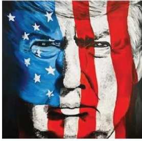
도널드 J. 트럼프

이번 급습(Raid)이 단순한 법 집행을 넘어선 정치적·전략적 의도가 있다고 단정하기에는 신중할 필요가 있다. 우선, 해당 공장의 이민 및 안전 관련 운영 관행에는 명백히 심각한 문제가 있었으며, 이러한 문제만으로도 법 집행 조치가 충분히 정당화될 수 있었을 것으로 판단된다. 또한 이번 작전이 어느 정도 사전 조율 하에 이루어졌는지는 불분명하지만, 그 수준은 제한적이었을 가능성이 높다. 실제로 트럼프 대통령은 소셜미디어에 다음과 같이 게시하며, 미국 내 투자를 환영하는 한편, 외국 기업들이 미국의 이민법을 준수할 것을 동시에 요구했다.